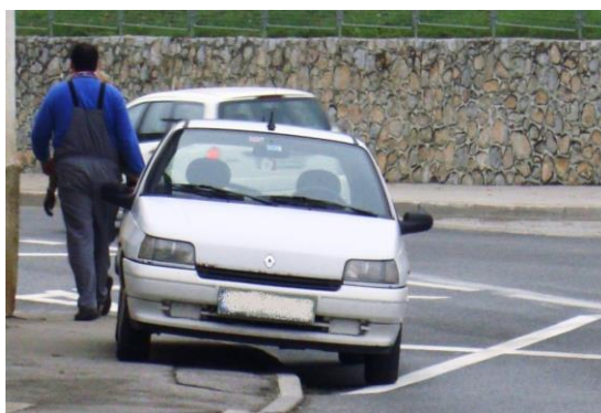
Slika 11: nepravilno parkirano vozilo na magistralni cesti (Trubarjeva cesta)