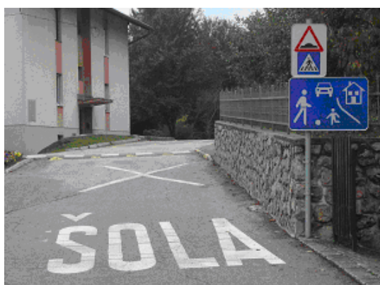
Slika 4: del Šolske ulice

Prometna infrastruktura neposredno pred šolo je zelo ozka in srečevanje vozil je zelo oteženo, predvsem z avtobusom, ki v jutranjem času pripelje in po pouku odpelje izpred šole. Največjo težavo srečevanja oziroma vožnja mimo parkiranih vozil povzročata pozimi narinjen sneg na robove vozišča.