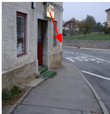
Slika 9: Pogled na ožino z drugega zornega kota

Nevarnost predstavljajo vozniki – kupci ali vozniki dostavnih vozil, ki obišejo trgovino in z vožnjo vzvratno ogrožajo pešce in druge udeležence v prometu, ki so lahko v tem trenutku neposredno za vozilom. Naslednjo nevarnost predstavlja ozek prehod med voziščem in vogalom stavbe. To mesto je posebej nevarno v primeru vožnje tovornih vozil s polpriklopnikom in priklopnikom iz smeri Ljubljane proti Kočevju, ko lahko nehote z zadnjim delom prikolice oplazijo pešca.