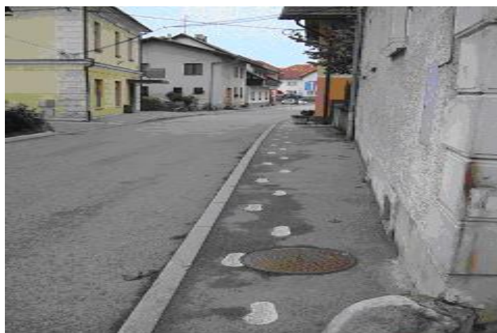
Slika 3: Stritarjeva cesta od glasbene šole proti centru