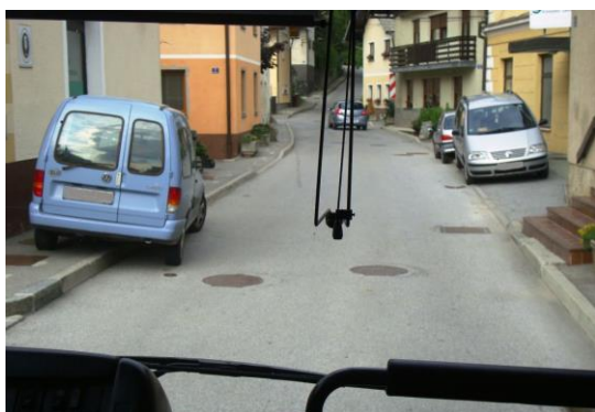
Slika 10: nepravilno parkirano vozilo na varni poti v šolo

Na spodnjih slikah so nazorno prikazane nepravilnosti parkiranja na šolski poti in neposredno pred šolo. V nekaterih primerih ovirajo otroke pri hoji po šolski poti, v drugih primerih pa otežujejo vožnjo šolskemu avtobusu.