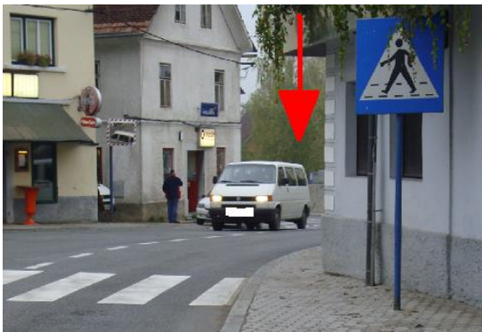
Slika 7: Ozko mesto pri prehodu čez magistralno cesto

Prvo nevarno mesto v tem križišču je pri gostilni PRI KUKLJU.