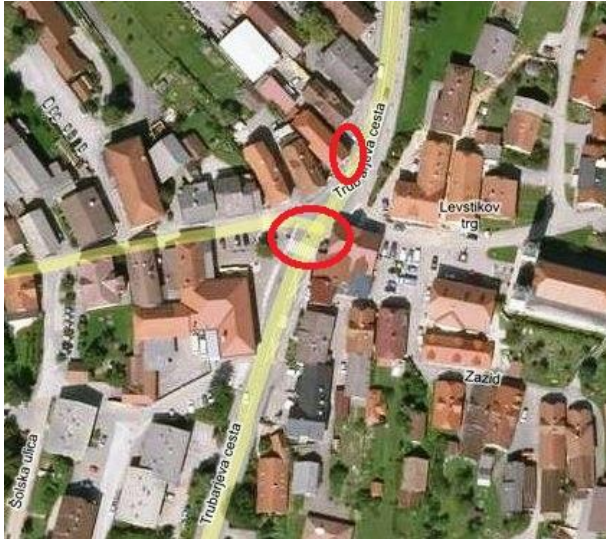
Slika 6: Tloris glavnega križišča v Velikih Laščah

Prvo nevarno mesto v tem križišču je pri gostilni PRI KUKLJU.