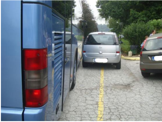
Slika 12: nepravilno parkiranje ovira vožnjo šolskega avtobusa