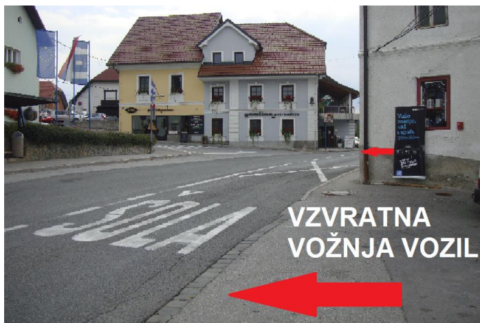
Slika 8: Nevarno mesto pri trgovini TRGOUP