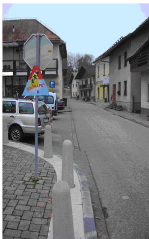
Slika 2: Stritarjeva cesta v smeri proti šoli

Skozi Velike Lašče je s stopinjami označena pešpot. Vodi od gostilne Pri Kuklju po zaznamovanem prehodu za pešce čez magistralno cesto, preko trga in po pločniku (slika 2 in 3) mimo glasbene šole. Poleg že označene poti na pločnikih učenci lahko uporabljajo tudi druge poti, ki so primerne in so označene na spodnji tlorisni sliki centra naselja Velike Lašče (slika 1). Predvsem gre za pločnike ob glavni cesti Ljubljana – Kočevje in po poti v kulturnem parku pod stanovanjskimi bloki in glavno cesto.