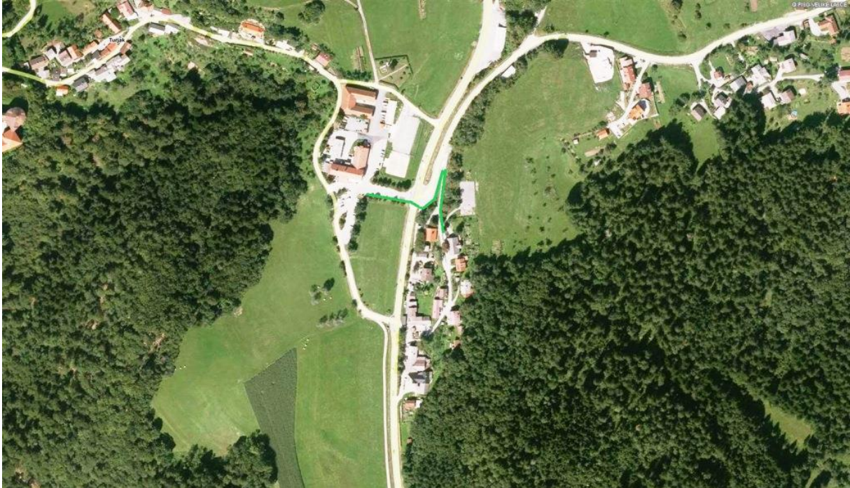
Slika 13: Tlorisni pogled na nevarno križišče v Turjaku

Do PŠ Turjak učenci pridejo večinoma s šolskim kombijem/minibusom oziroma s starši. Kombi vedno pripelje učence do šole, medtem ko bo minibus učence odložil na avtobusni postaji, od tam pa se bodo v spremstvu učiteljice po označeni šolski poti odpravili do šole.