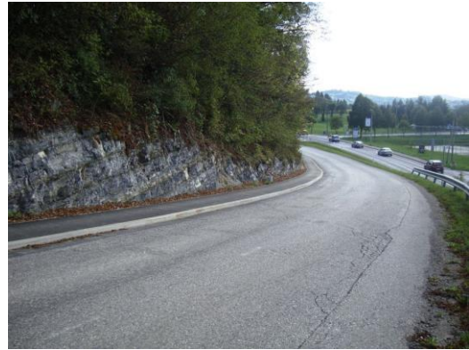
Slika 16: Potek pločnika v Turjaku 2