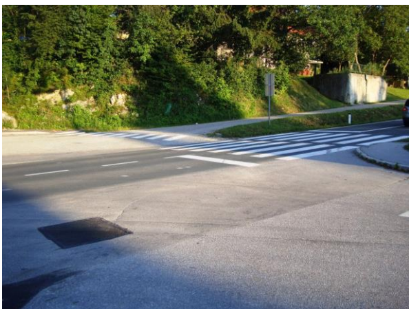
Slika 14: Prehod za pešce čez magistralno cesto

Križišče pa je sicer iz smeri Grosuplja zelo nepregledno, saj se cesta priključuje pod ostrim kotom, zato je preglednost omogočena z ogledalom.