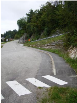
Slika 15: Potek pločnik v Turjaku 1

Od glavne ceste oziroma omenjenega križišča proti Gradežu je zgrajen pločnik, le manjši odsek v dolžini cca 60 m je nedograjen in predstavlja oviro za pešce, saj bodo pešci najverjetneje hodili po vozišču. Na spodnjih slikah je prikazan potek in posebej označen del nedograjenega pločnika in vse do odcepa za naselje Gradež, kjer je zarisan tudi prehod za pešce na hitrostni oviri.