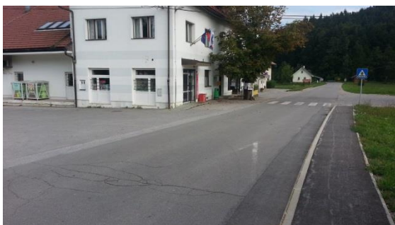
Slika 21: Okolica PŠ Rob