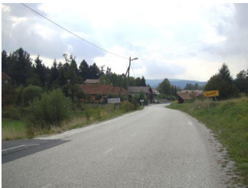
Slika 17: Del ceste proti Gradežu, kjer ni pločnika