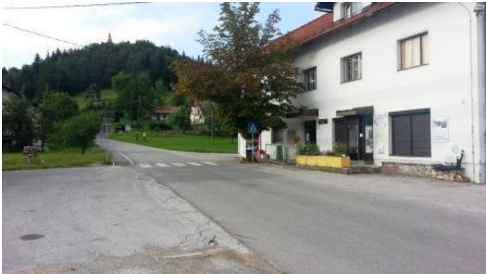
Slika 20: Podružnična šola Rob

Podružnična šola Rob se nahaja v zgradbi, kjer imata svoje prostore tudi trgovina in Zavod PARNAS (slika 20).