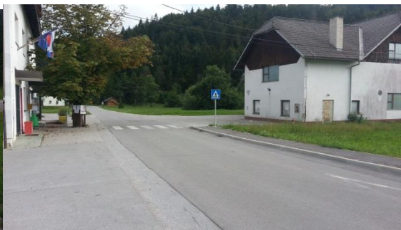
Slika 22: Okolica PŠ Rob

Glavnina otrok se v šolo pripelje z kombi prevozom ali z starši. Ena učenka prihaja peš po urejenem pločniku po levi strani ceste (gledano v smeri vožnje proti Sekirišču), ki vodi do vaškega središča nekoliko višje (križišče Rob-Golo) (slika 23).