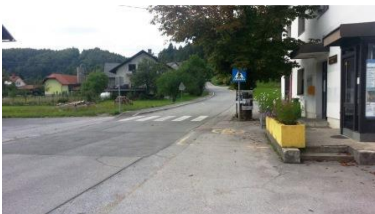
Slika 24: Označen prehod za pešce

Za prehod čez lokalno cesto je poskrbljeno preko prehoda za pešce, ki je ustrezno označen z prometno signalizacijo (slika 24).