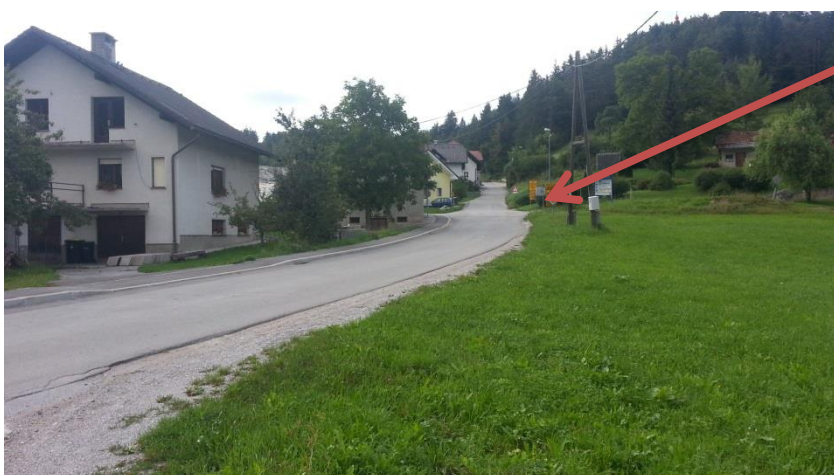
Slika 23: Pločnik ob cesti

Glavnina otrok se v šolo pripelje z kombi prevozom ali z starši. Ena učenka prihaja peš po urejenem pločniku po levi strani ceste (gledano v smeri vožnje proti Sekirišču), ki vodi do vaškega središča nekoliko višje (križišče Rob-Golo) (slika 23).